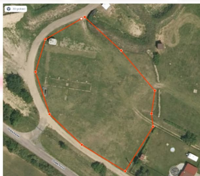
Lower Shooting range

V zónách 1 a 2 bude možnost připojení k elektrické síti. Možnost připojení k elektrické síti je limitována kapacitou připojení.