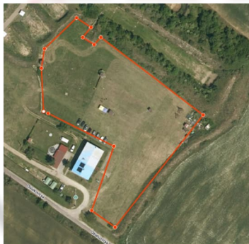
Shotgun Shooting range